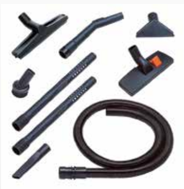
Tillval för Cleanserv VL1-15 och VL1-30

Vi reserverar oss för rättigheten att göra tekniska förbättringar på maskinen som påverkar form, design & färg. Maskinerna på bilderna kan ha tillvalsfunktioner.