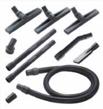
Tillval för Cleanserv VL3-70 I