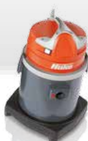
Cleanserv VL1-15 Cleanserv VL1-30