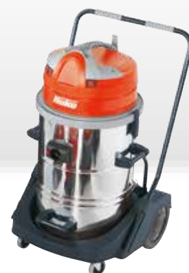
Cleanserv VL3-70 I